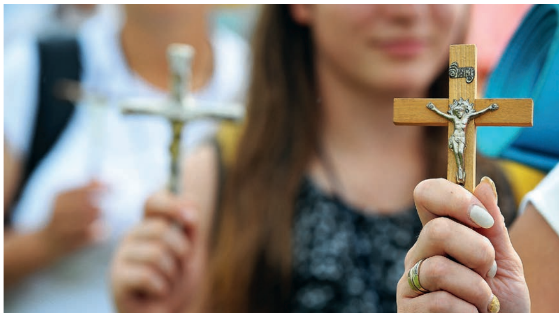
Krzysztof Świertoń/Archivum Niedzieli