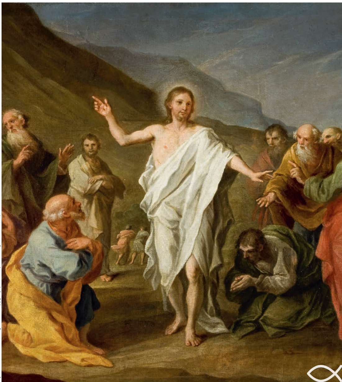
Szymon Czechowicz, Chrystus ukazujący się apostołom po zmartwychwstaniu, 1758